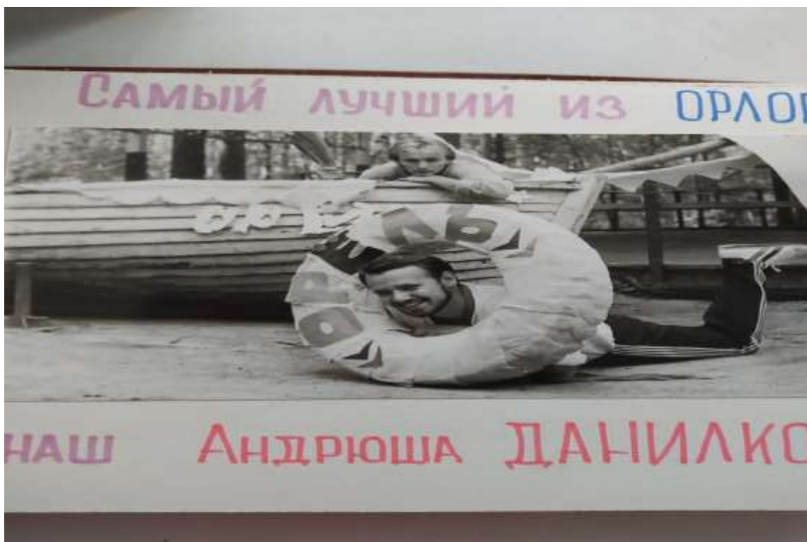
Привет из студенческой жизни

В 2021 году Фонд развития детских лагерей под его руководством и непосредственном участии сосредоточил внимание на вопросах повышения квалификации руководителей и специалистов лагерей. Проведено 7 очных семинаров, 8 вебинаров. Тематика: нормативно-правовое и организационно-деятельностное сопровождение деятельности детских лагерей, научно - методические основы деятельности детских лагерей. Проведены четыре научно-практических конференции.